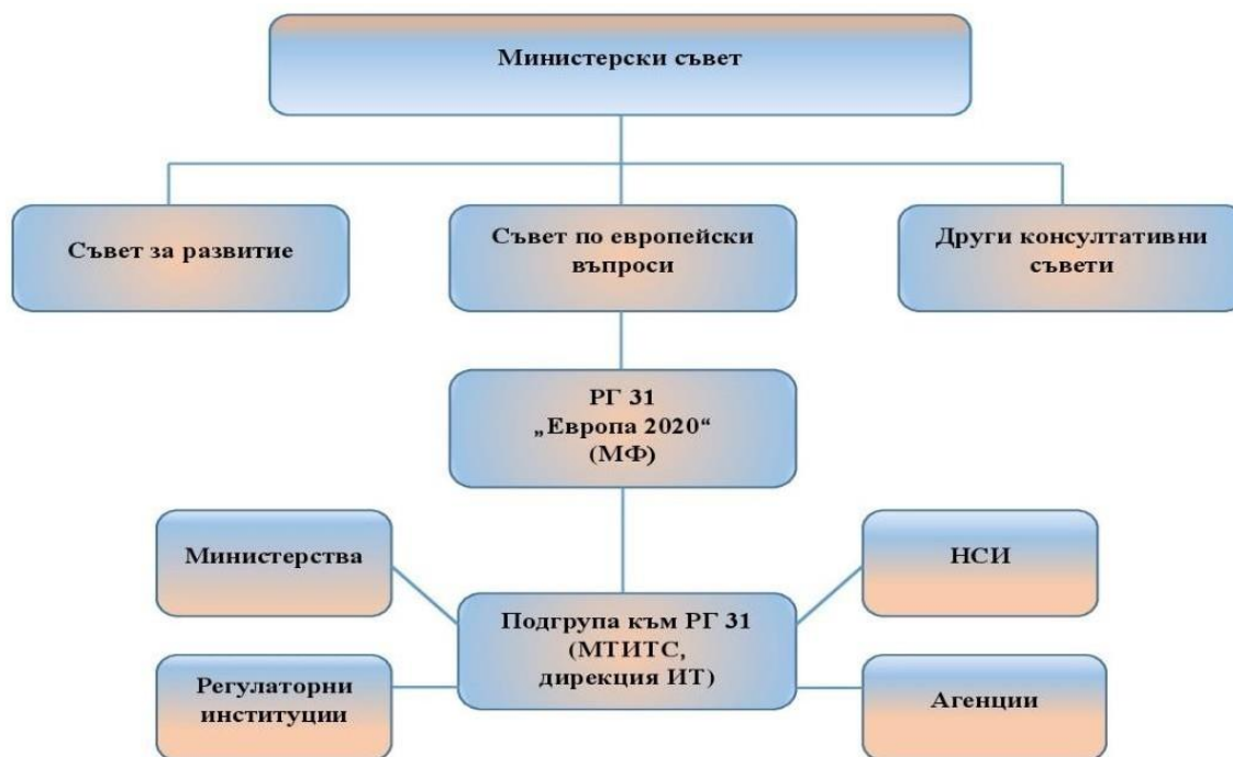
Фигура 3: Органиграма

Механизмът за управление, координация и контрол на програмата е част от националния координационен механизъм по въпросите на ЕС.