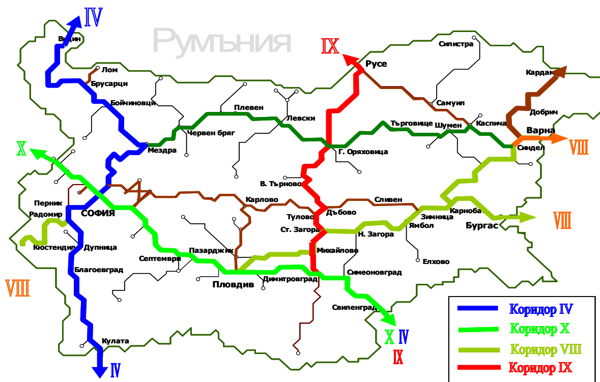
Карта на Общоевропейските коридори преминаващи през железопътната мрежа на Република България

The territory of Bulgaria is traversed by five European transport corridors – IV, VII, VIII, IX and X.